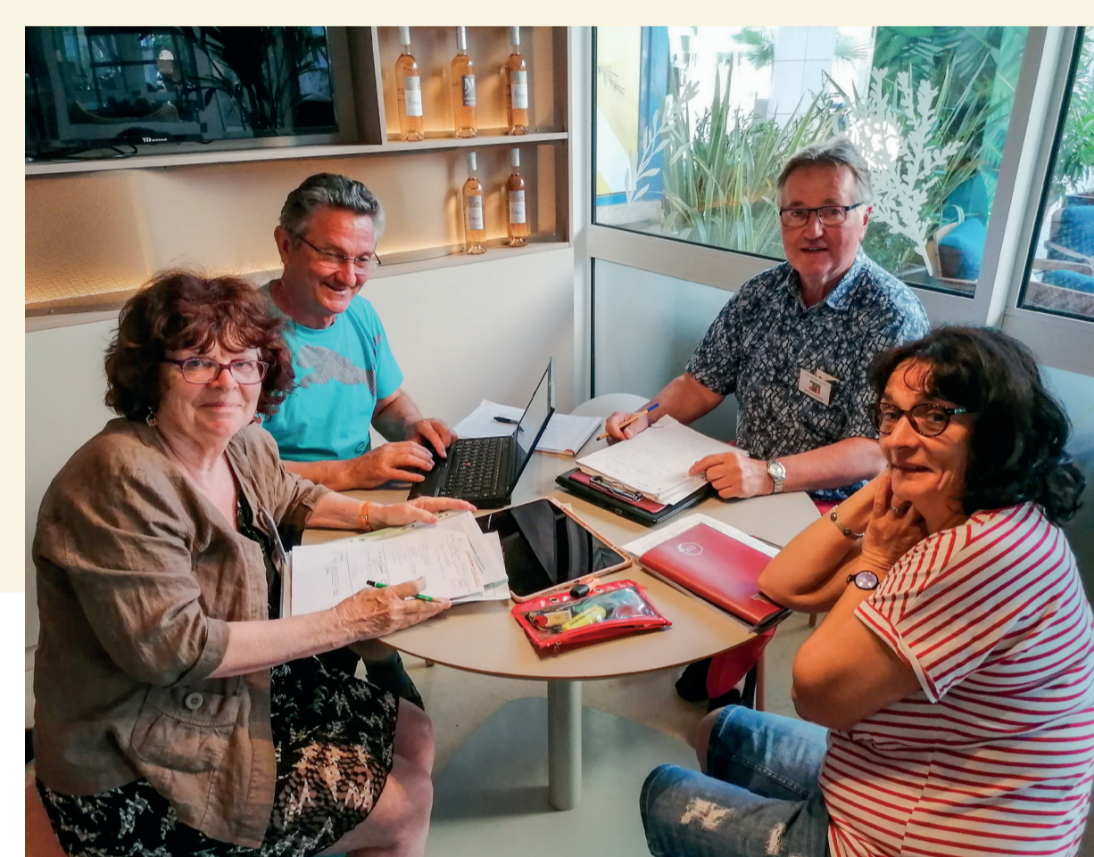
Deutsch-französische Arbeitsgruppensitzung im Hotel in Toulon. Die Eindrücke des Besichtigungstages werden ausgetauscht und Konzeptionsmodelle für die geplante Ausstellung zum Projekt diskutiert - Réunion d'un groupe de travail franco-allemand à l'hôtel à Toulon. Les impressions de la journée de visite sont échangées et des modèles de conception pour l'exposition prévue sur le projet sont discutés