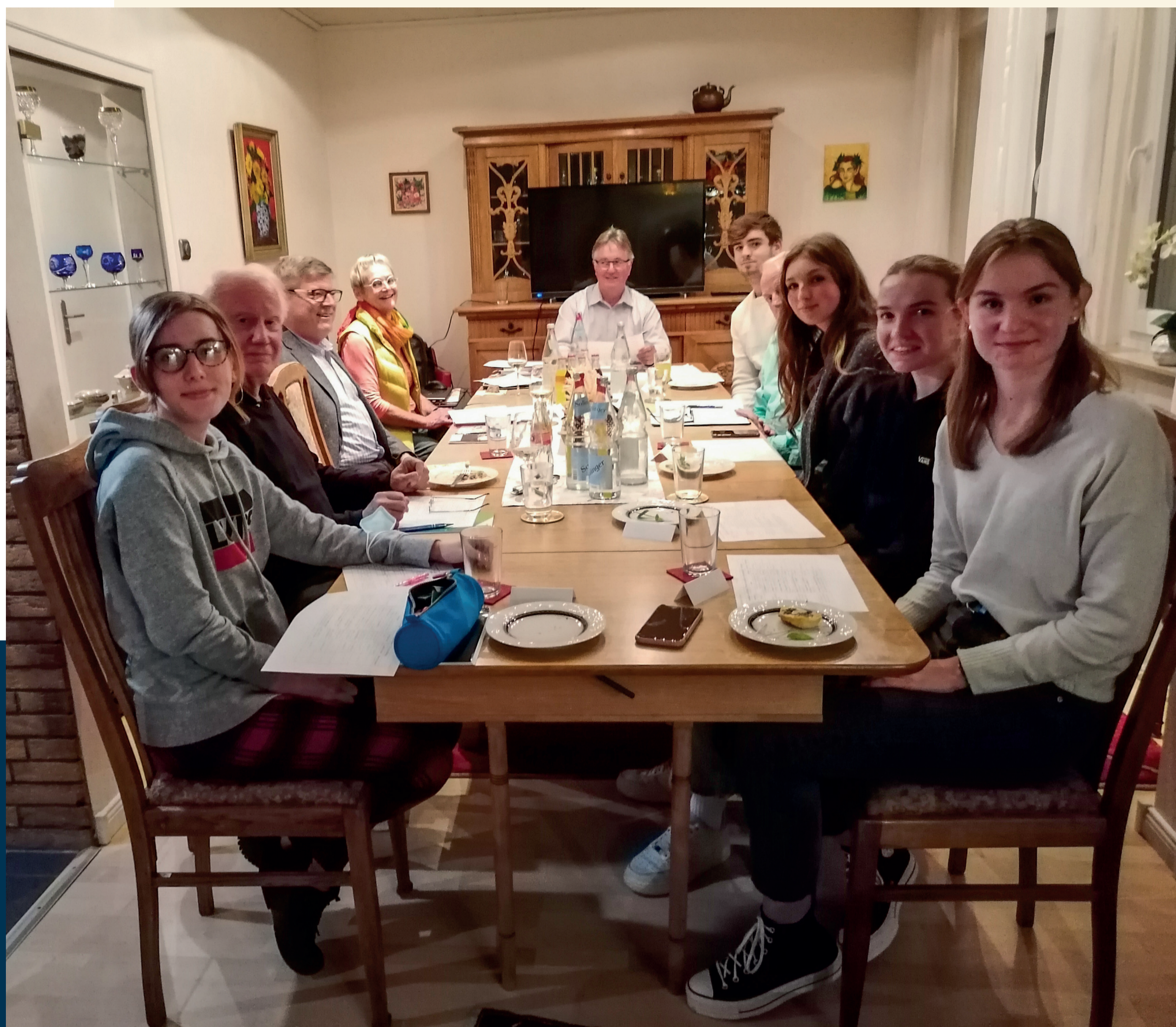
Planungssitzung der deutschen Projektgruppe im Herbst 2021 - Réunion préparatoire du groupe de projet allemand à l'automne 2021