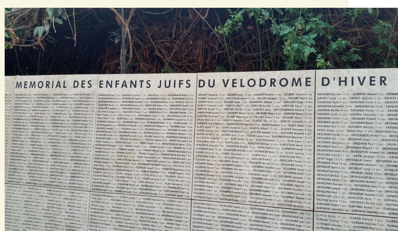
Mémorial des enfants juifs du Vélodrome d'hiver : nom et âge des 4 000 enfants rafles et déportés à Auschwitz - Gedenkstätte für jüdische Kinder im Vélodrome d'hiver: Name und Alter der 4000 Kinder, die zusammengetrieben und nach Auschwitz deportiert wurden.