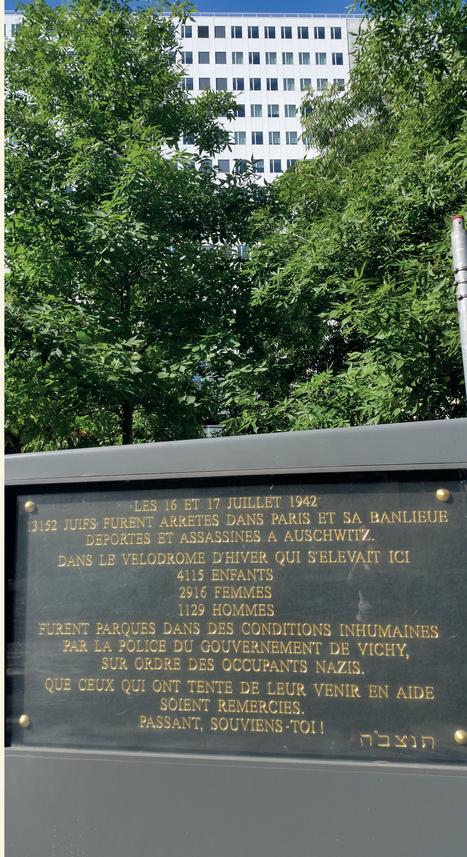
Plaque commémorant la rafle du Vel' d'Hiv' à Paris, inaugurée par J. Chirac. - Gedenktafel zur Erinnerung an die Razzia von Vel' d'Hiv' in Paris, eingeweiht von J. Chirac

Eine denkwürdige Rede in der Geschichte der deutsch-französischen Beziehungen. 16. Juli 1995, Rede von Jacques Chirac im Vélodrome d'hiver: Anerkennung der Verantwortung des französischen Staates für die Razzia von Vel' d'Hiv'. (Massenfestnahmen mit anschließender Deportation)