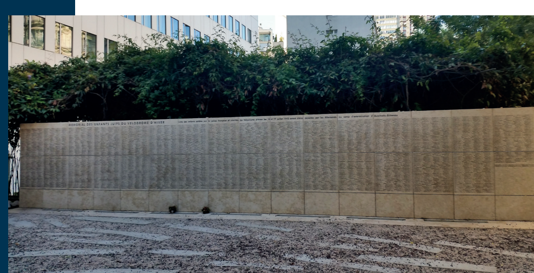
Monument vu en plan général - Denkmal in der Gesamtansicht

Nach der Rede von Vel' d'Hiv' werden die Gedenkfeiern nie mehr so sein wie zuvor. Der Geist der „Erinnerungsorte“ wird sich ändern: Die Schuld gegenüber den Opfern tritt an die Stelle der Schuld gegenüber den „Helden“.