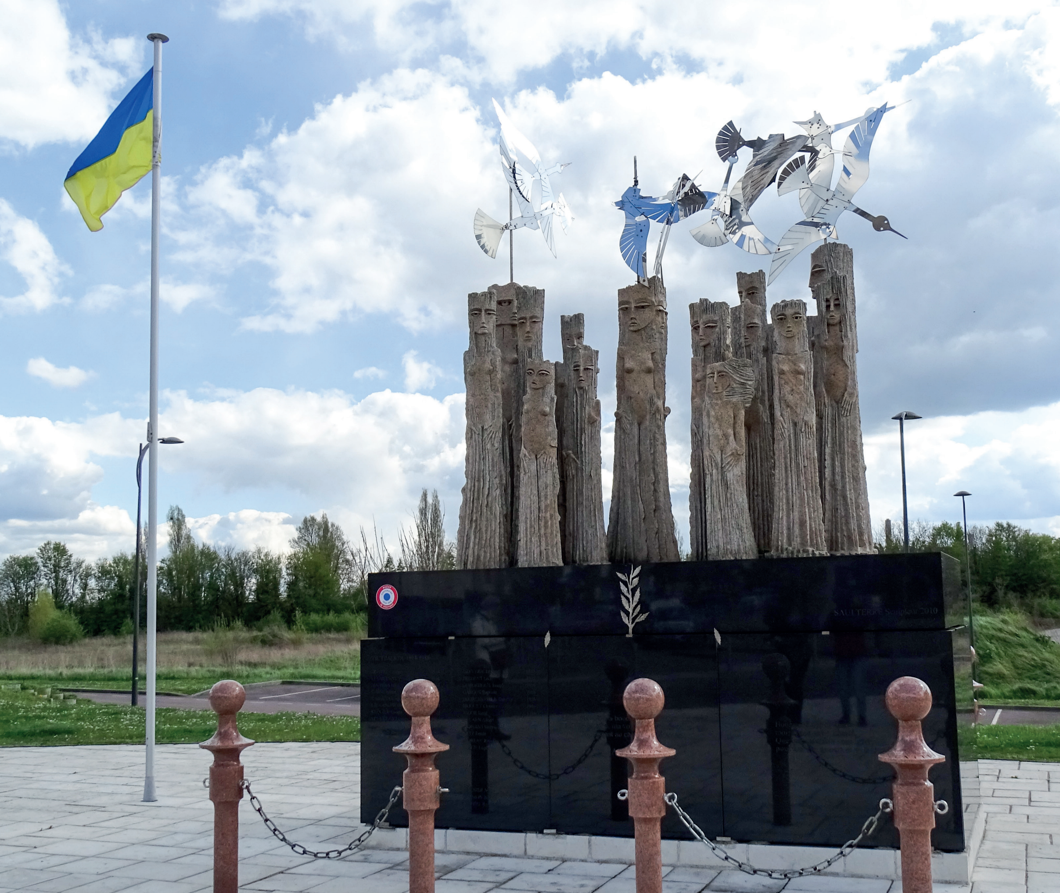
Le drapeau ukrainien donne toute son actualité aux propos du maire d'Alizay - Die ukrainische Flagge verleiht den Worten des Bürgermeisters von Alizay Aktualität