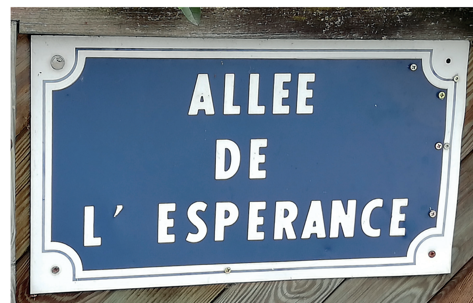
L'espérance est là, sans doute, aussi européenne ! - Die Hoffnung liegt zweifellos auch in Europa.

Für weitere Informationen - Pour en savoir plus: