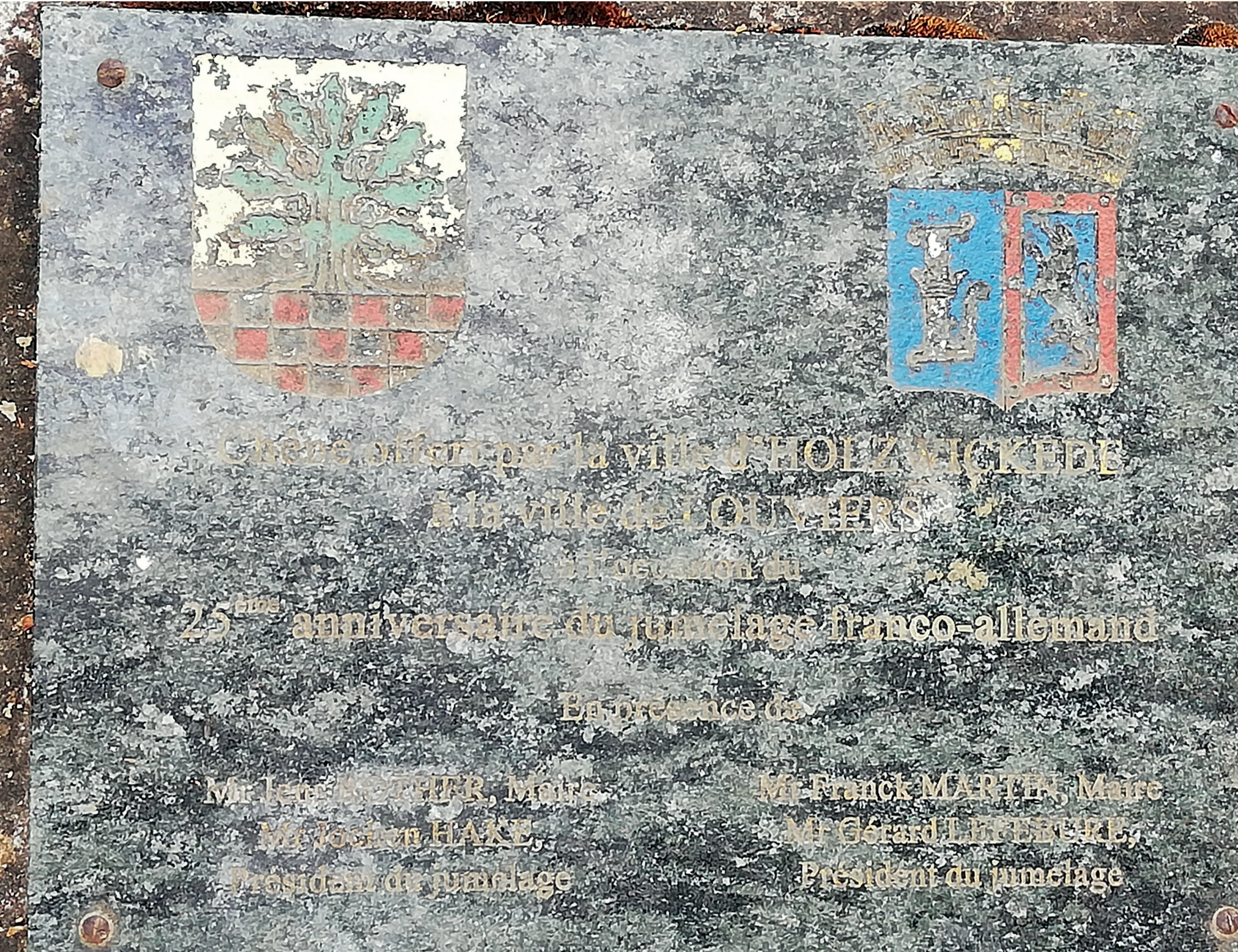
Le jumelage franco-allemand, outil pour l'avenir... À quelle place ? - Die deutsch-französische Städtepartnerschaft, ein Instrument für die Zukunft... Welche Rolle soll sie spielen?