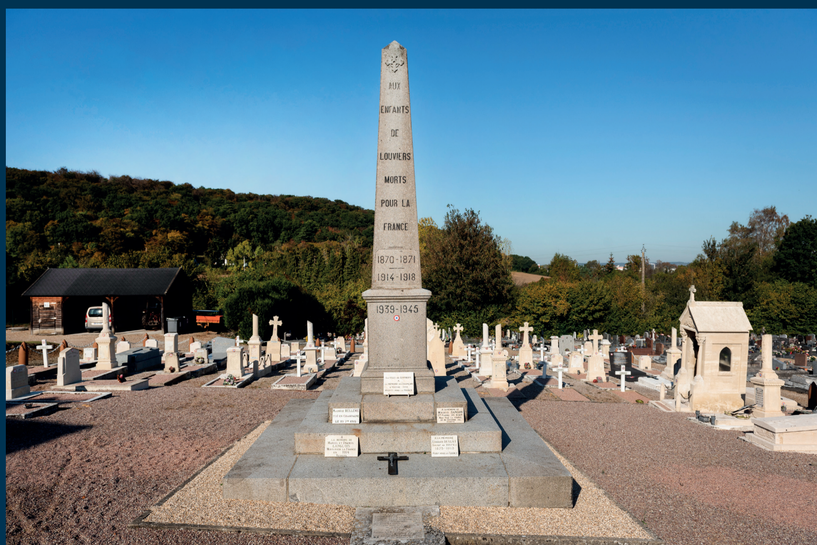
L'obélisque du cimetière de Louviers [1904] - Der Obelisk auf dem Friedhof von Louviers [1904]

La salle des plaques (1922) : La loi de 1919 incite chaque commune à édifier un monument aux morts ; l'hécatombe de 1914-18, frappant les plus petites communes, suscite un profond besoin de commémoration, associant citoyens, municipalités et Etat, au-delà des décisions officielles ou des manifestations nationalistes. Plutôt qu'un troisième monument coûteux, Louviers opte pour de sobres plaques de marbre portant, au sein de la Mairie, les noms et grades des 351 tués de la commune.