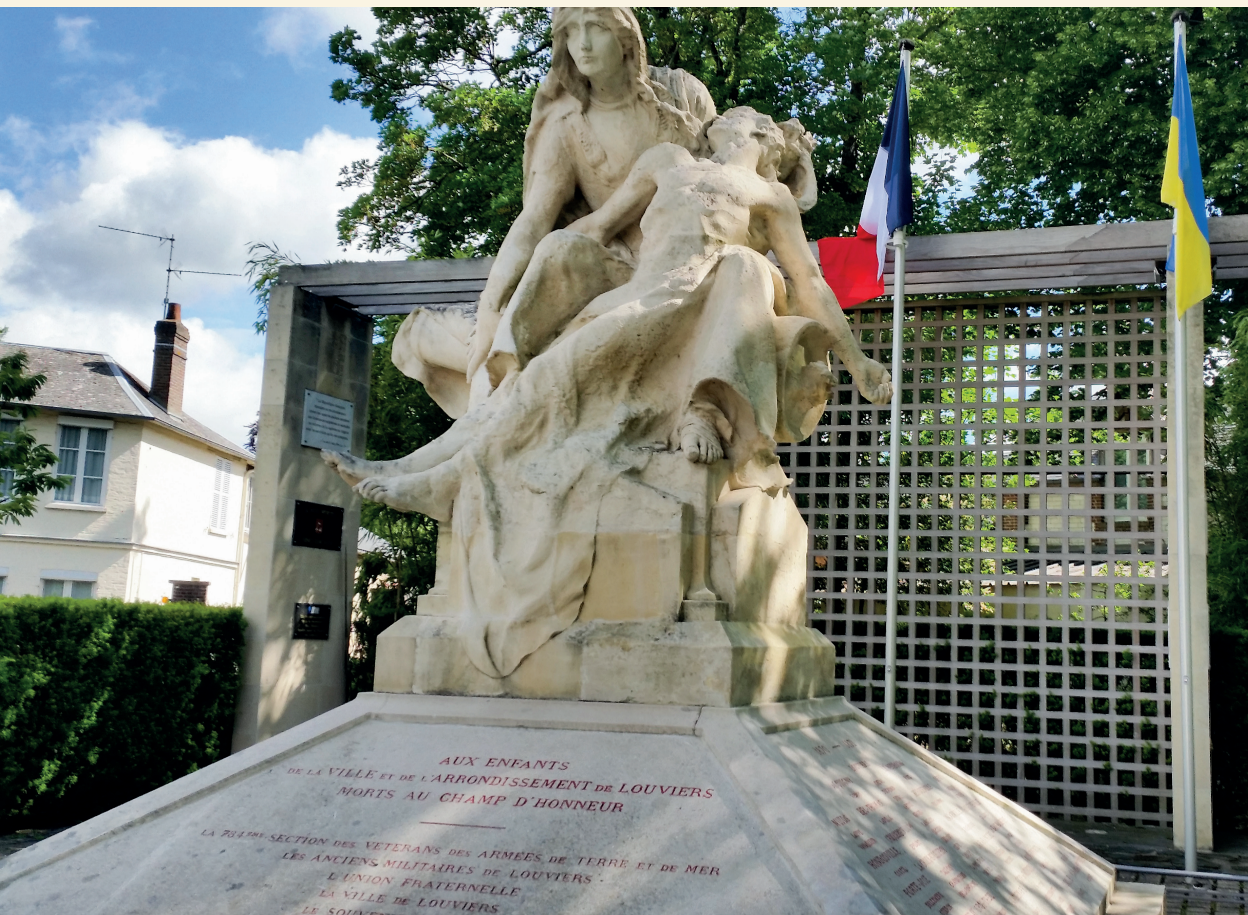
Le monument du square Albert 1er [1907] - Das Denkmal auf dem Platz Albert I. [1907]