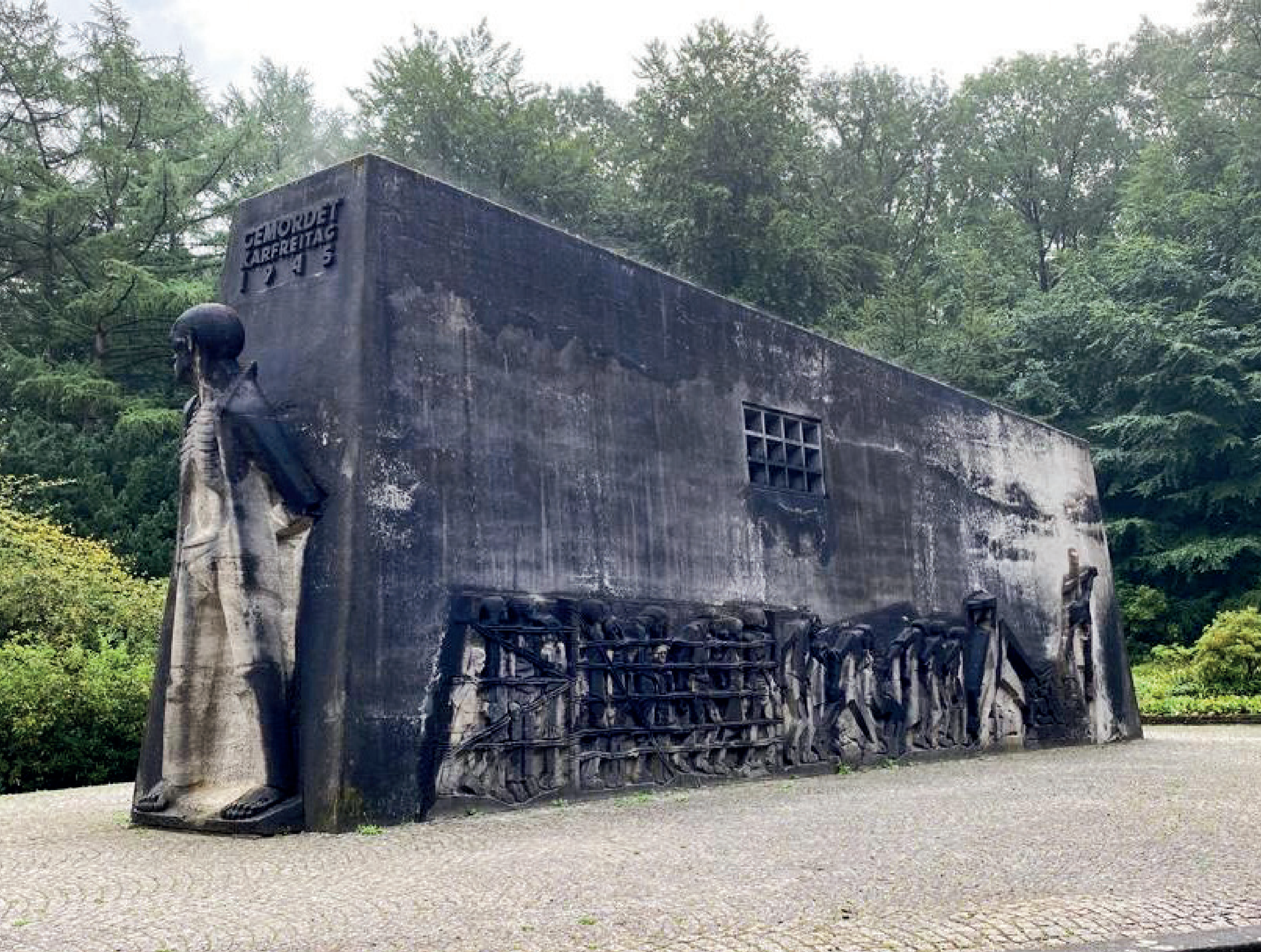
Das Mahnmal Bittermark in Dortmund - Le mémorial Bittermark à Dortmund

Gedenktafel für französische Zwangsarbeiter über dem Eingang zur Krypta, die vom französischen Künstler Léon Zack gestaltet wurde - Plaque commémorative pour les déportés du travail de France au-dessus de l'entrée de la crypte, laquelle a été réalisée par l'artiste français Léon Zack