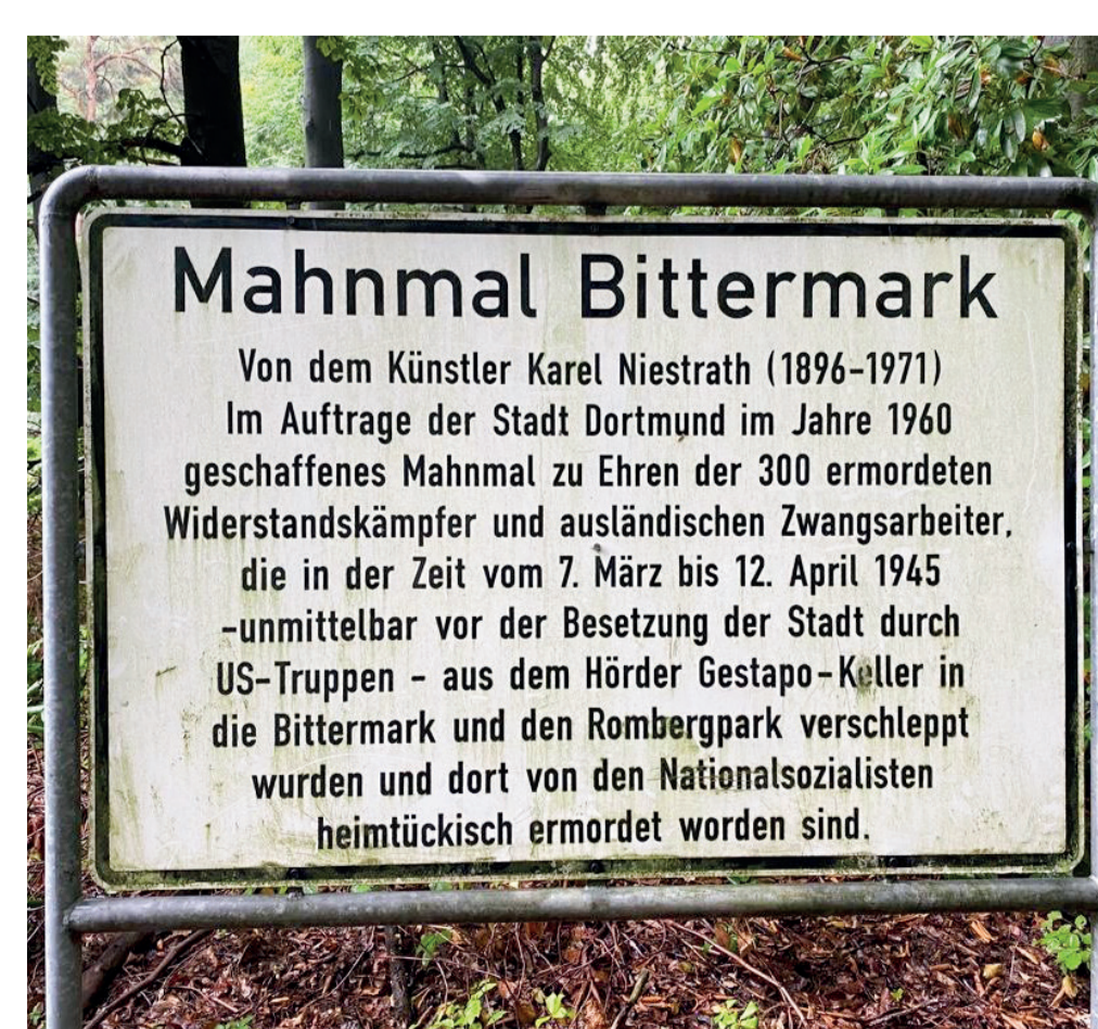
Erläuterungen zum Mahnmal für Besucher - Explications sur le mémorial pour les visiteurs

Zu Recht kann von einem deutsch-französischen Gedenkort gesprochen werden.